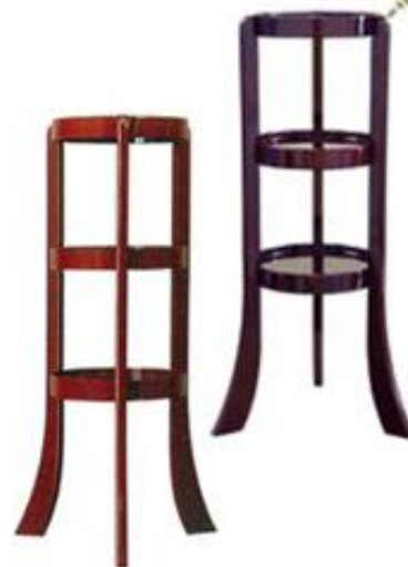
三段盛 (朱塗り・溜塗り)