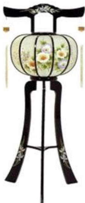
回転灯籠 翠 二号