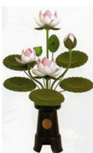
ワンタッチ蓮華四灯