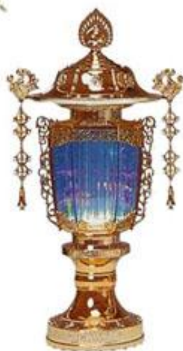
光泡灯 (バブル灯) 二号