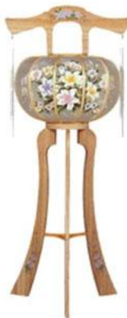
回転灯籠 静 二号